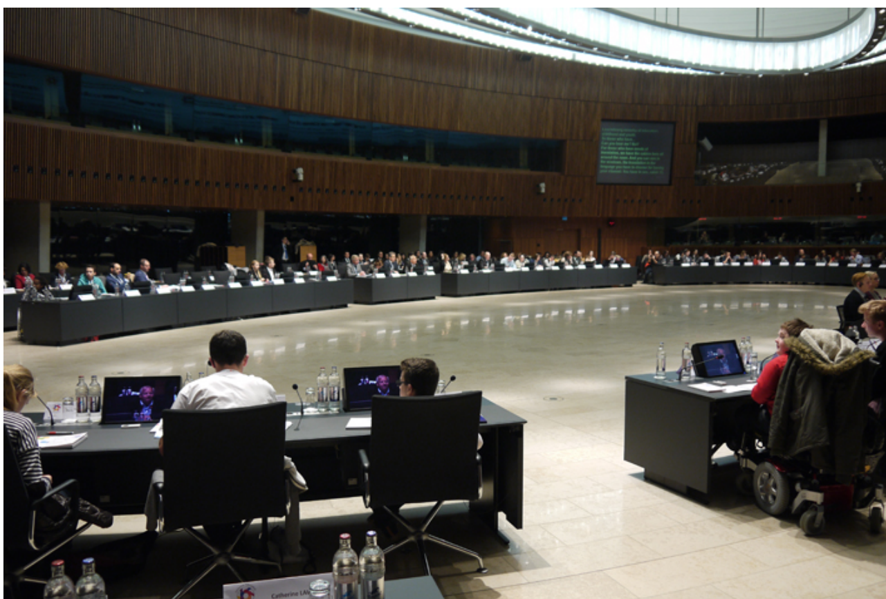
Slika 2: Mladi delegati i ostali predstavnici na europskom Sastanku

Glavni rezultati rasprava na radionicama predstavljeni su na plenarnoj sjednici u obliku ključnih poruka i bili su temelj za formulaciju Luksemburških preporuka .