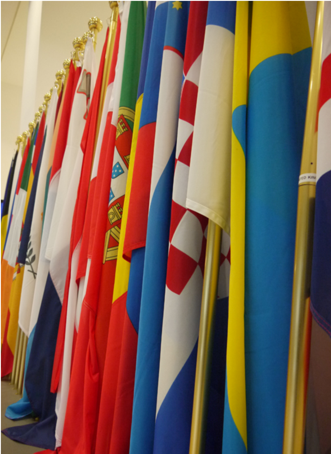
Slika 1: Zastave država članica Agencije