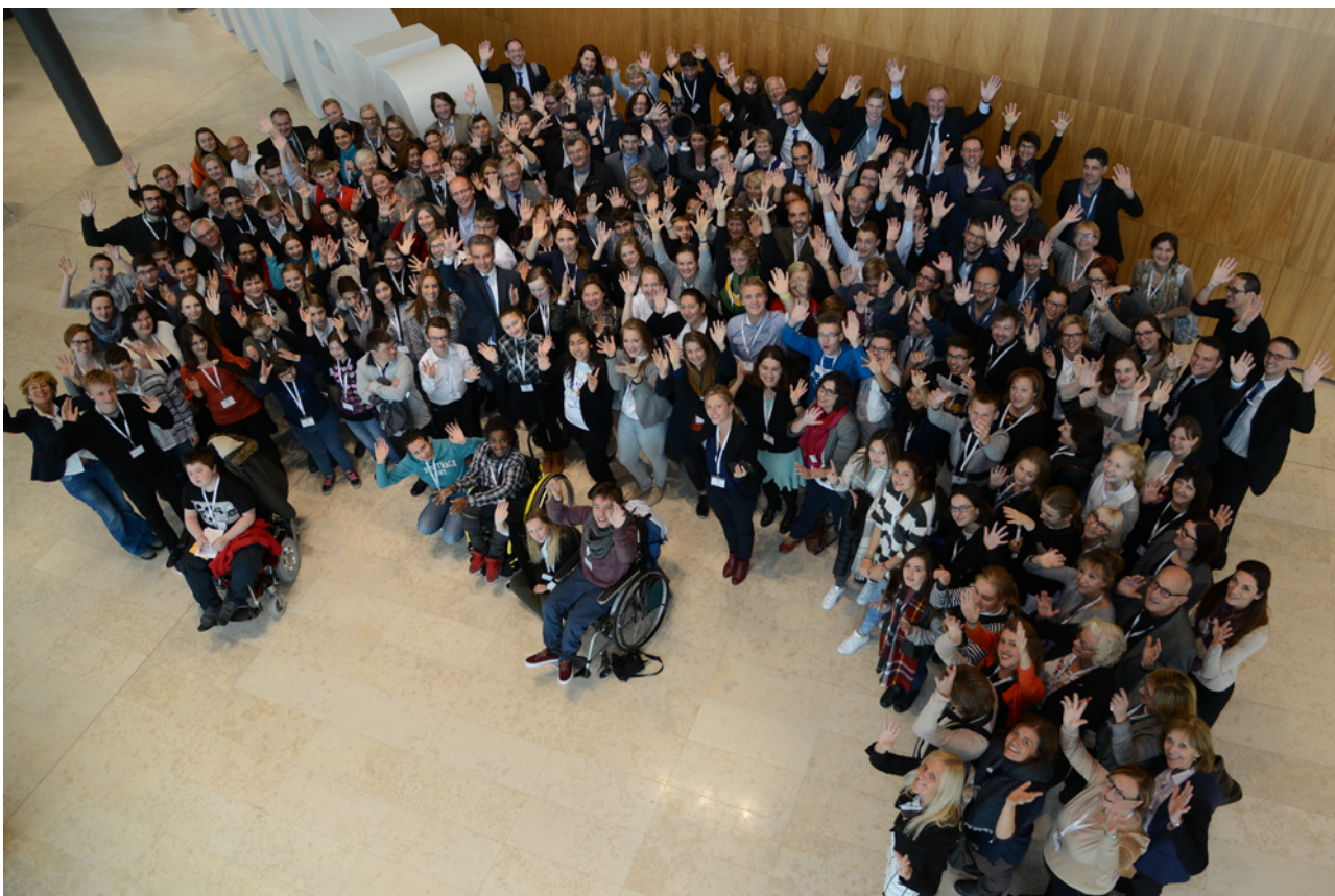
Slika 5: Sudionici na europskom Sastanku