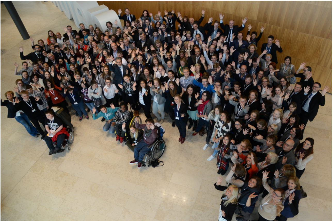
Kuva 5: Eurooppalaisen kuulemistilaisuuden osallistujajoukko

Luxemburgin suosituks et esiteltiin EU:n ministerineuvostolle ”Koulutus, nuoriso, kulttuuri ja urheilu” -kokouksessa 23. marraskuuta 2015 ja ministerineuvoston alaiselle koulutuskomitealle 2.–3. joulukuuta 2015 arviointia varten ja mahdollisten jatkotoimien pohjaksi.