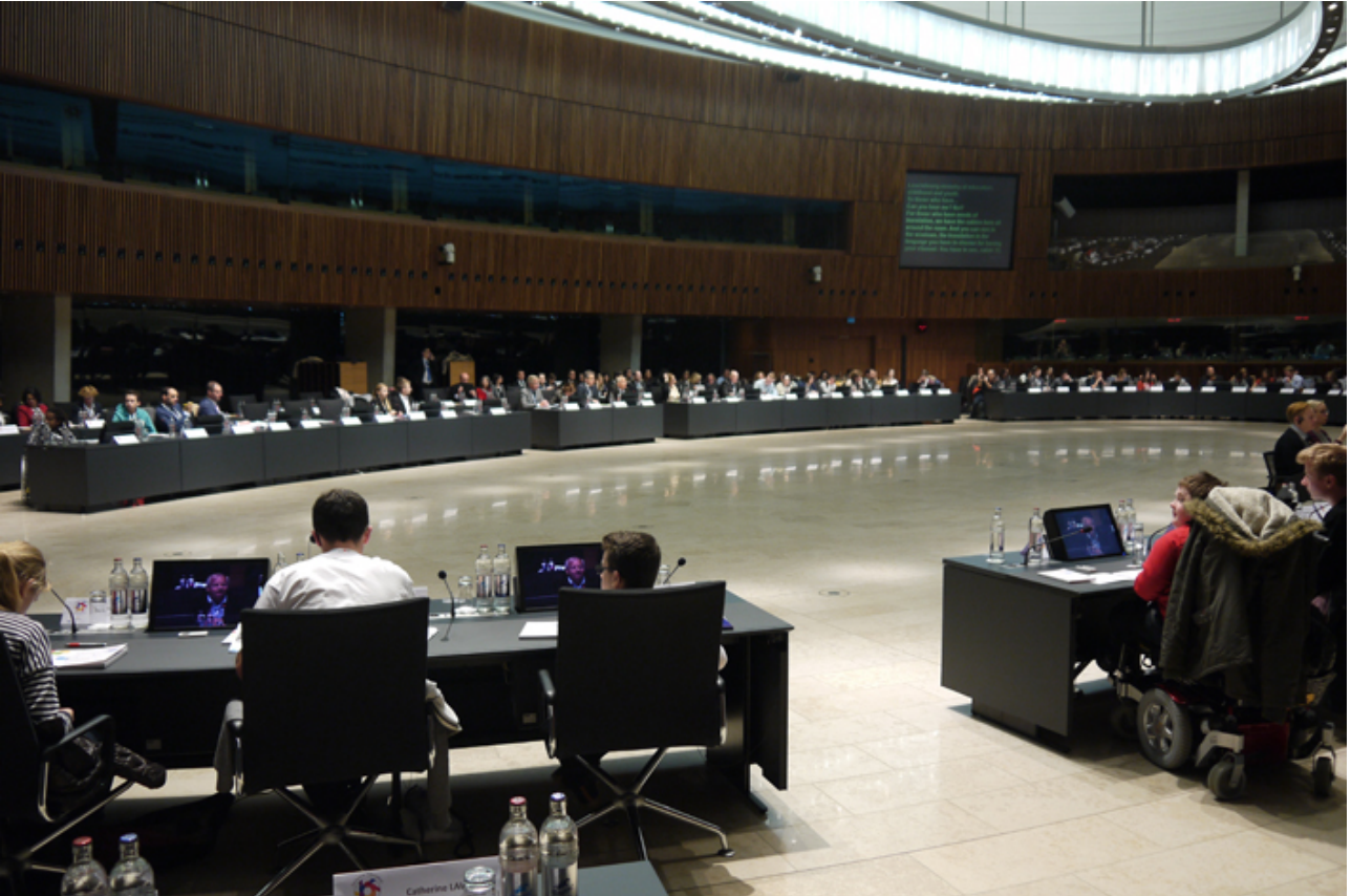
Kuva 2: Nuoria ja muita edustajia eurooppalaisessa kuulemistilaisuudessa

esittämät tiedot ja parannusehdotukset on koottu yhteen ja tiivistetty yhteenvedoksi. Tämän aineiston pohjalta kehittämiskeskus on laatinut Luxemburgin suosituks . Näiden suositusten avulla kehittämiskeskus pyrkii tukemaan inklusiivisen opetuksen toimeenpanoa kaikissa tähän soveltuviissa opetusympäristöissä. Suositukset on koottu ja ryhmitelty viiden pääviestin alle. Nämä viestit saatiin nuorilta heidän keskustelujensa ja tulosten esittelyn yhteydessä.