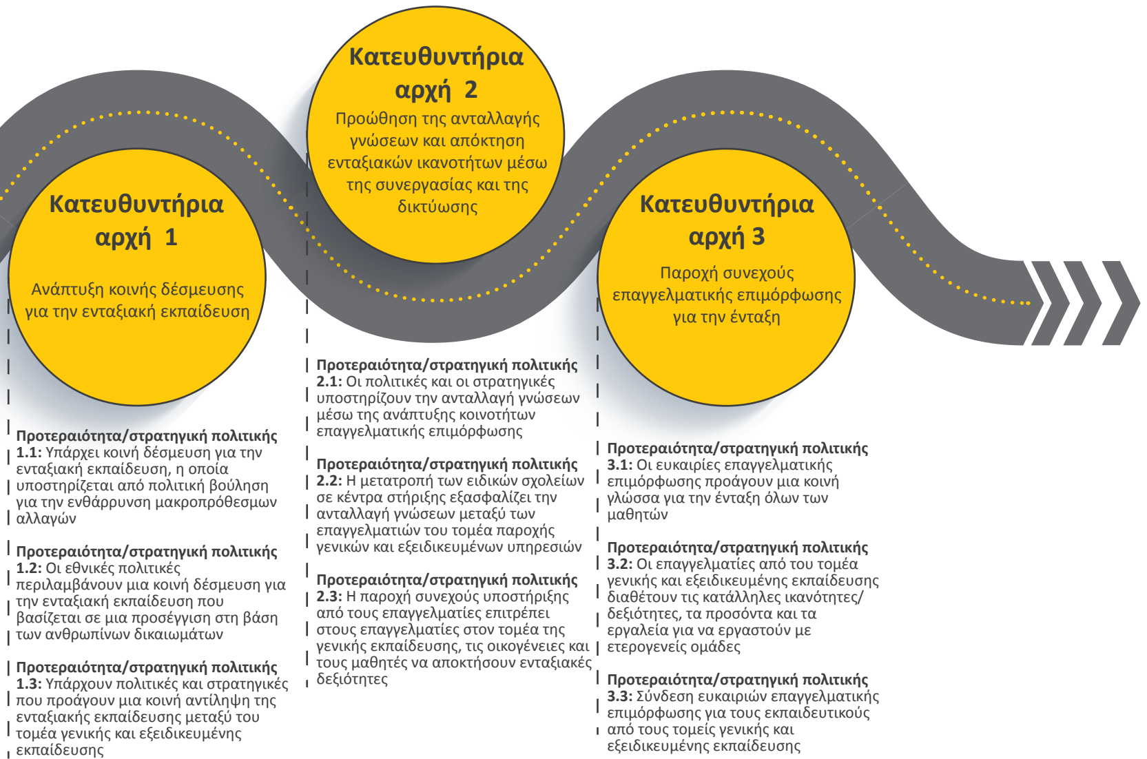
Σχήμα 2. Ο χάρτης πορείας CROSP