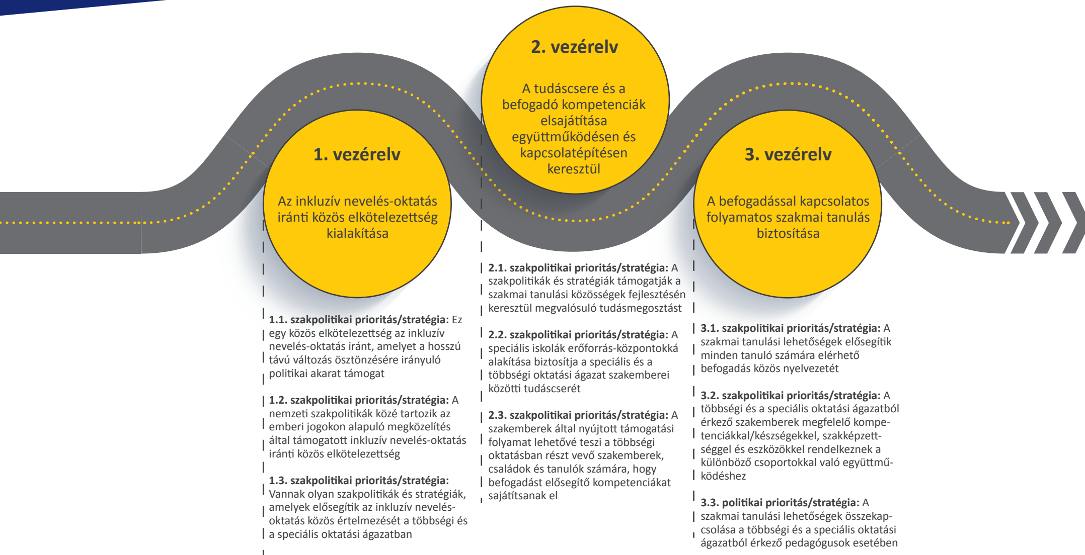
2. ábra. A CROSP-ütemterv