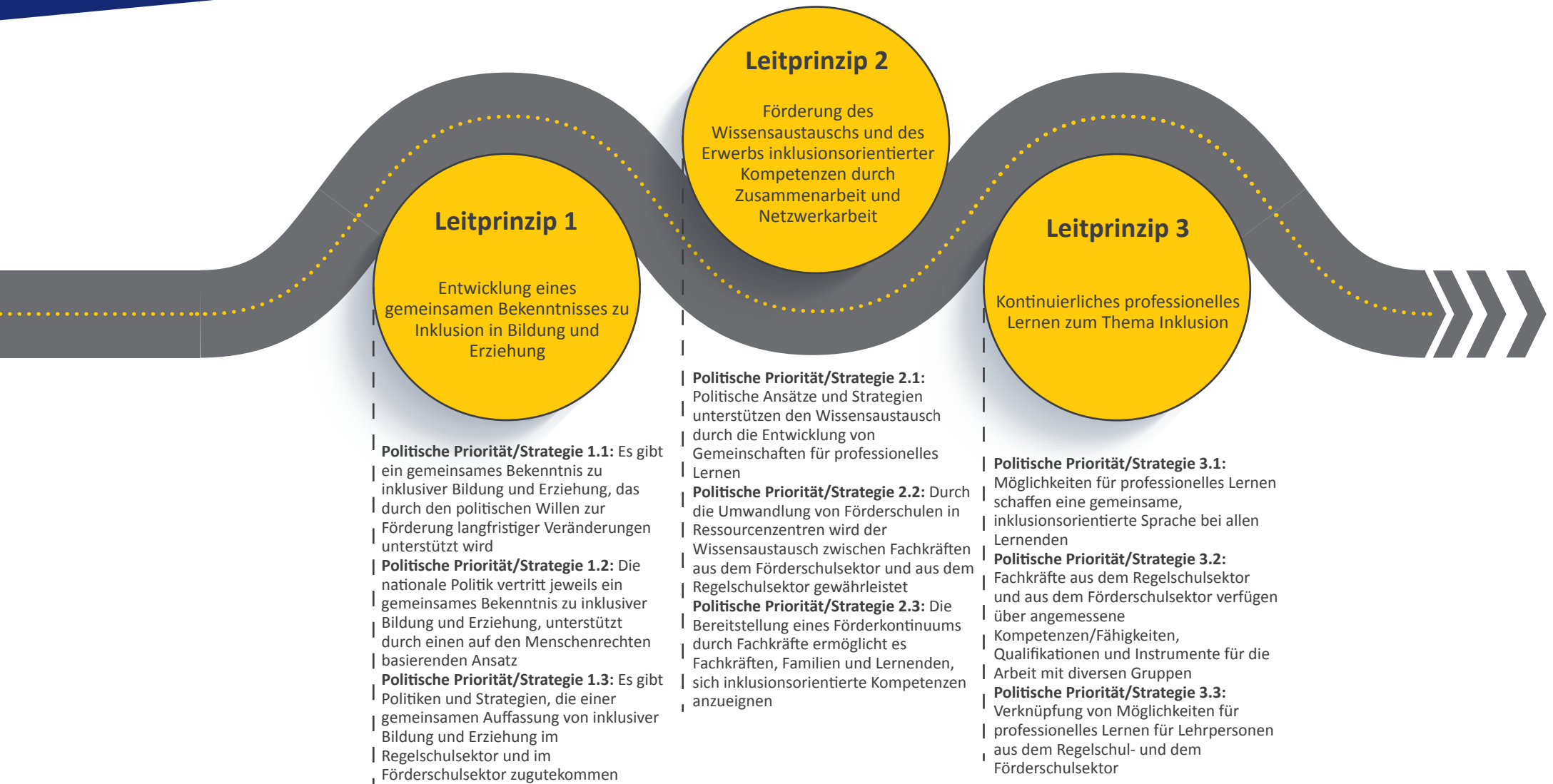
Abbildung 2. Der CROSP-Fahrplan