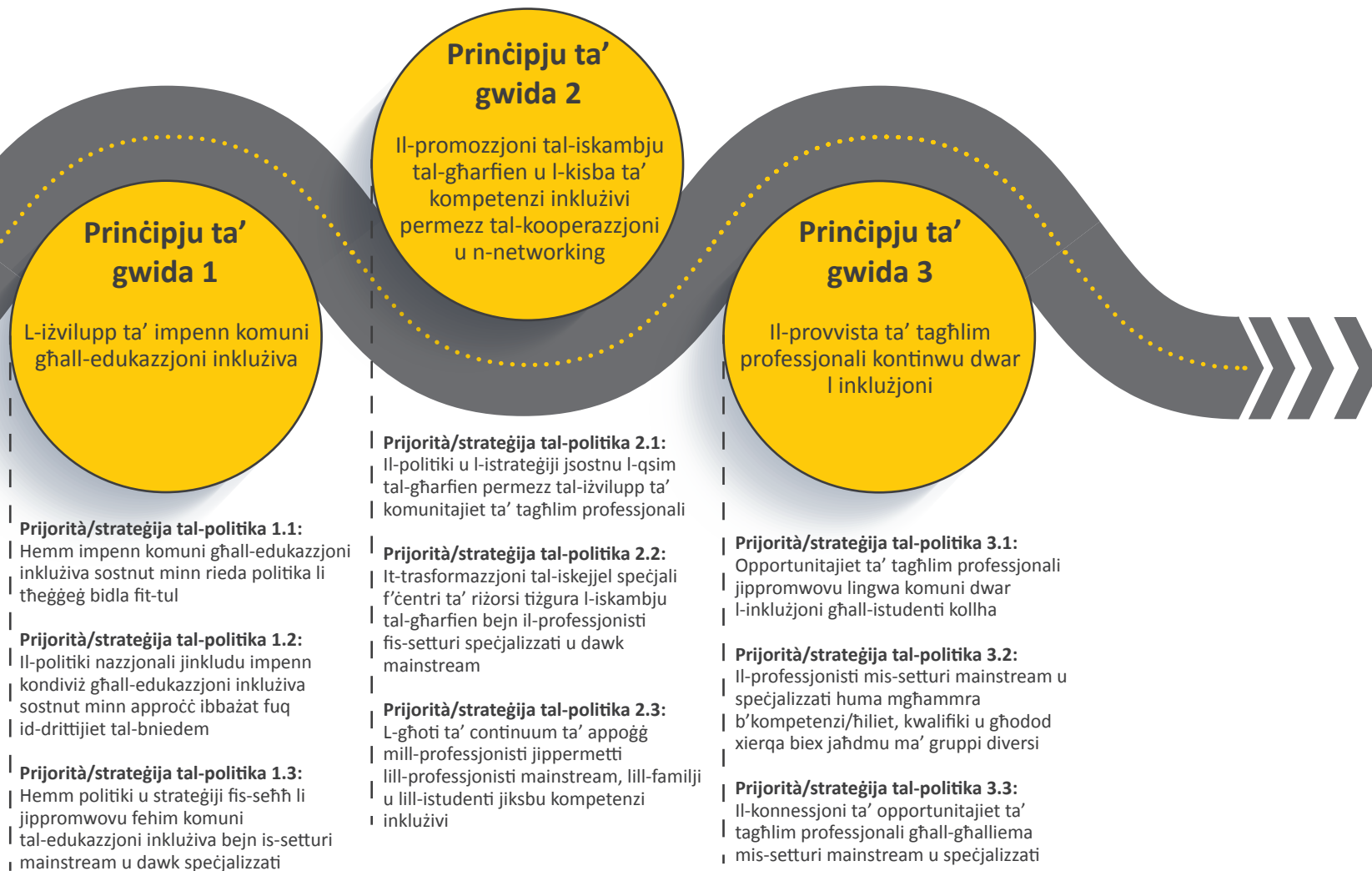
Figura 2. Il-pjan direzzjonali ta' CROSP